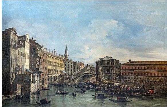
Le pont du